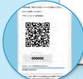
二次元バーコード &アポイントコード