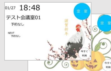
例) 季節イベント画像